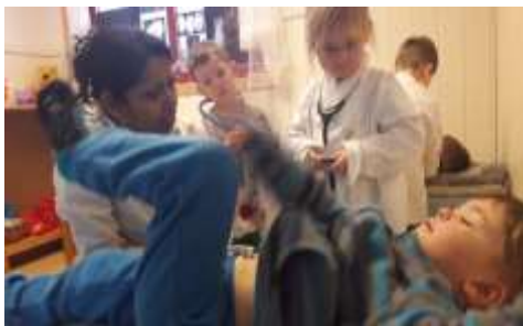
«Legevakten» inspirert fra boken «Thomas går til doktoren» fra stasjonslek mars 2017

Vi er opptatte av å videreutvikle stasjonsleken med utgangspunkt i barnas tilbakemeldinger, og de voksnes opplevelser og ønsker. I fjor skapte barnelitteratur rammene for stasjonsleken, og vi åpnet opp for at det var barna som valgte litteraturen. I år vil stasjonsleken bli knyttet til temaet folkeeventyr og barna vil være med å velge eventyrene vi vil bruke.