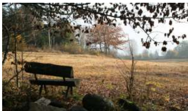
Akebakken ved Solberg Gård, Fjordvangen